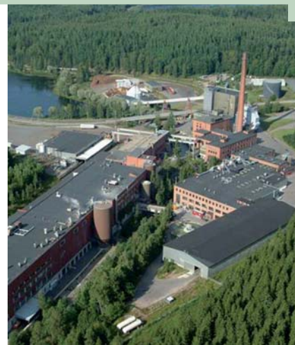
Fábrica de cartón

Los resultados muestran el fuerte compromiso de constante mejora. El objetivo de las fábricas de cartón es utilizar menos madera y energía y ser más eficientes en cuanto a los recursos. Se utilizaron menos combustibles fósiles en la producción de las fábricas y se empleó más biomasa. Esto llevó a un menor consumo de recursos fósiles y a una reducción en las emisiones de dióxido de carbono, dióxido de azufre y óxido de nitrógeno. Además, se disminuyeron las emisiones al agua.