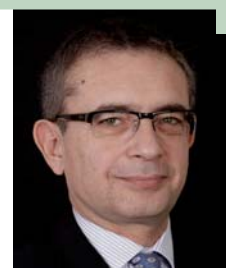
Jean-Marc Saubade, Director General de "Consumer Goods Forum"

sus necesidades está fomentando una tremenda innovación de las marcas y en formatos minoristas. Mientras tanto, es alentador observar que la responsabilidad corporativa no solo ha resistido a las presiones de la crisis económica, sino que ha ascendido en la clasificación este año – prueba de que su influencia en la agenda empresarial es algo permanente."