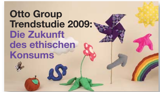
Estudio realizado por la Agencia de Tendencias de Hamburgo

de masas. Es necesario un esfuerzo de desarrollo mayor para conseguir un mejor efecto."